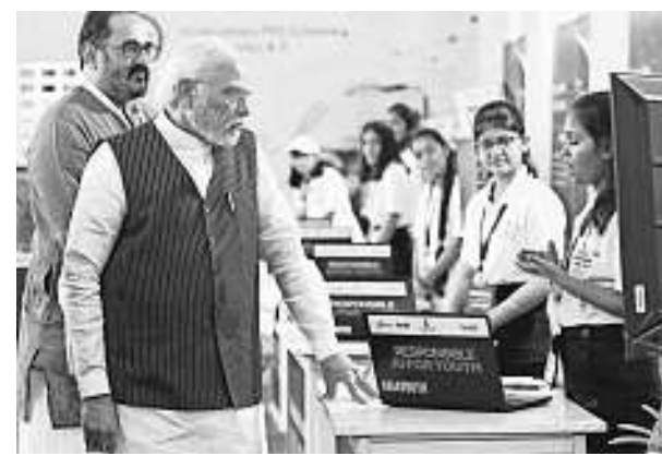
PM Narendra Modi and Minister of State for Electronics and Information Technology Rajeev Chandrasekhar at an exhibition held as part of Digital India Week 2022 in Gandhinagar on Monday.